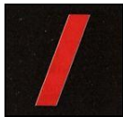
Sapeur 1 ère classe