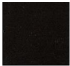
Sapeur 2 ème classe